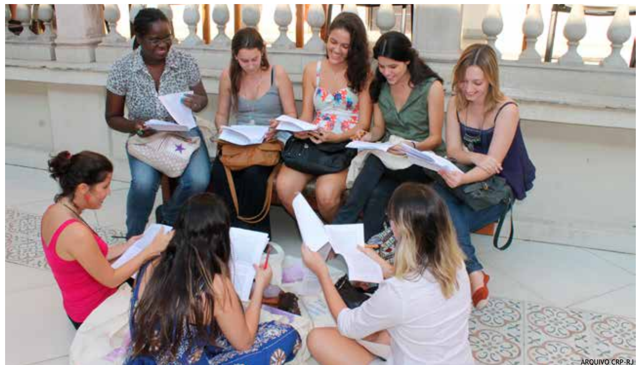
9ª Mostra consolida-se como espaço para trocas de ideias e experiências entre seus participantes.