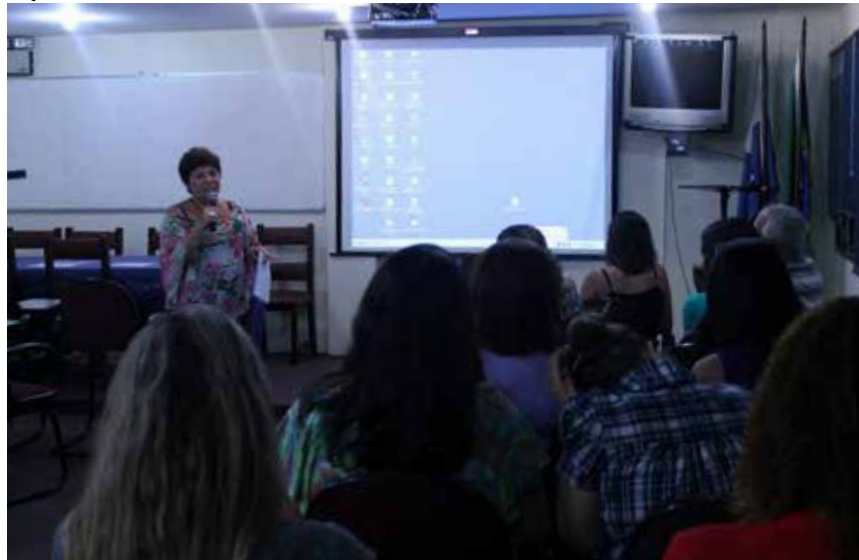
Evento no CRP-RJ para debater a atuação de psicólogas (os) no Sistema Prisional

esvaziando o conteúdo desse importante expediente de trabalho do juiz da execução penal”. Acrescenta que o CFP “extrapolou os limites de sua competência, ferindo o princípio da legalidade ao estabelecer vedações não previstas em lei violou o direito ao livre exercício profissional dos psicólogos (previsto no art. 5º, XIII, da CF)”, entre outros argumentos.