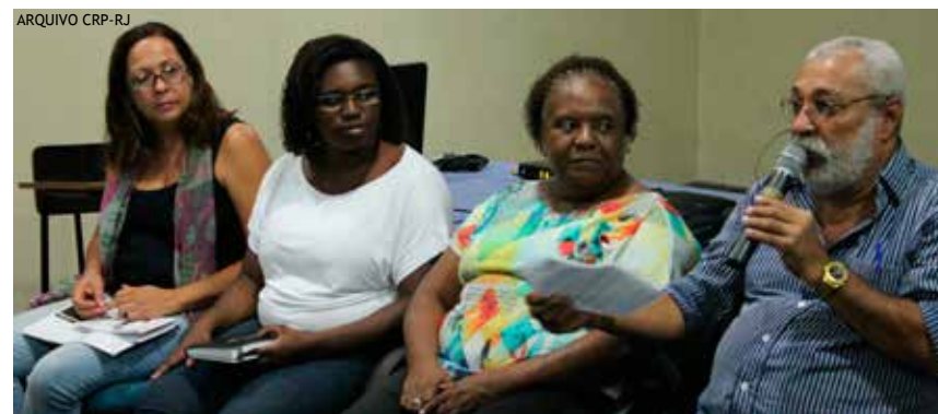
CinePsi na Subsede Baixada movimenta profissionais e estudantes

Em agosto, fizemos o I Seminário em comemoração ao Dia da (o) Psicóloga (o), que reuniu mais de 100 pessoas na Subsede, em Nova Iguaçu.