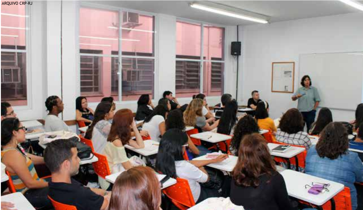
Apresentações de trabalho de psicólogas(os) e estudantes lotaram as 11 salas durante os três dias de evento.