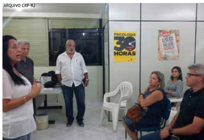
Roda de conversa “Ética e Condições de Trabalho” na subsede em Campos

Contatos: (22) 2728-2057/ E-mail administrativo: subsedecampos@crprj.org.br